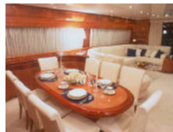
Abbildungen: Modell „Optanta“