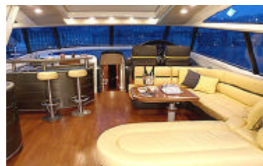
Abbildungen: aktuelles Modell

Großzügige Verglasung macht die Baia Atlantica 78 fast schon zu einem Wintergarten auf dem Wasser. Der je nach Motorisierung bis zu 60 kn schnell sein kann. Hans Wischer hat den rasanten Cruiser vor Neapel gefahren.