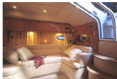
Abbildungen: Aktuelles Modell